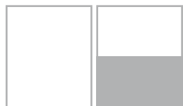
1/2 ГОР. ОБРЕЗ 115x195 мм* вылеты 118x198 мм*