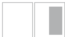
Dining / Shopping 1/2 текст и фото