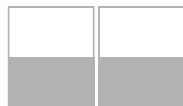
2 x 1/2 ГОР. ОБРЕЗ 117x390 мм* вылеты 135x400 мм*