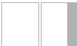
1/3 ВЕРТ. ОБРЕЗ 63x235 мм* вылеты 66x241 мм*