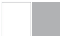
1/1 ПОЛОСА ОБРЕЗ 195x235 мм* вылеты 201x245 мм*