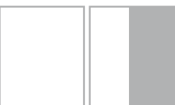
1/2 ВЕРТ. ОБРЕЗ 95x235 мм* вылеты 99x245 мм*